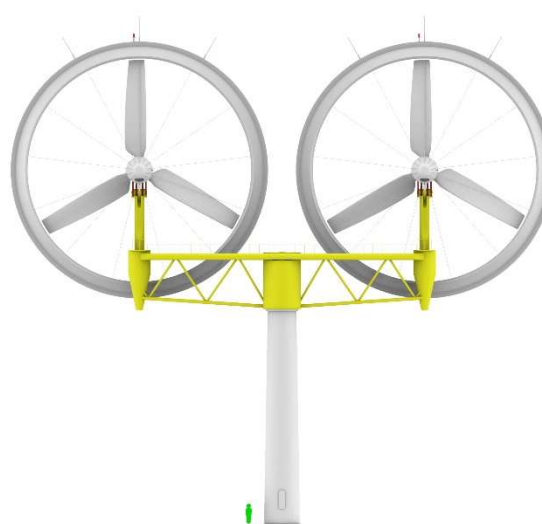
400kWマルチレンズ風車